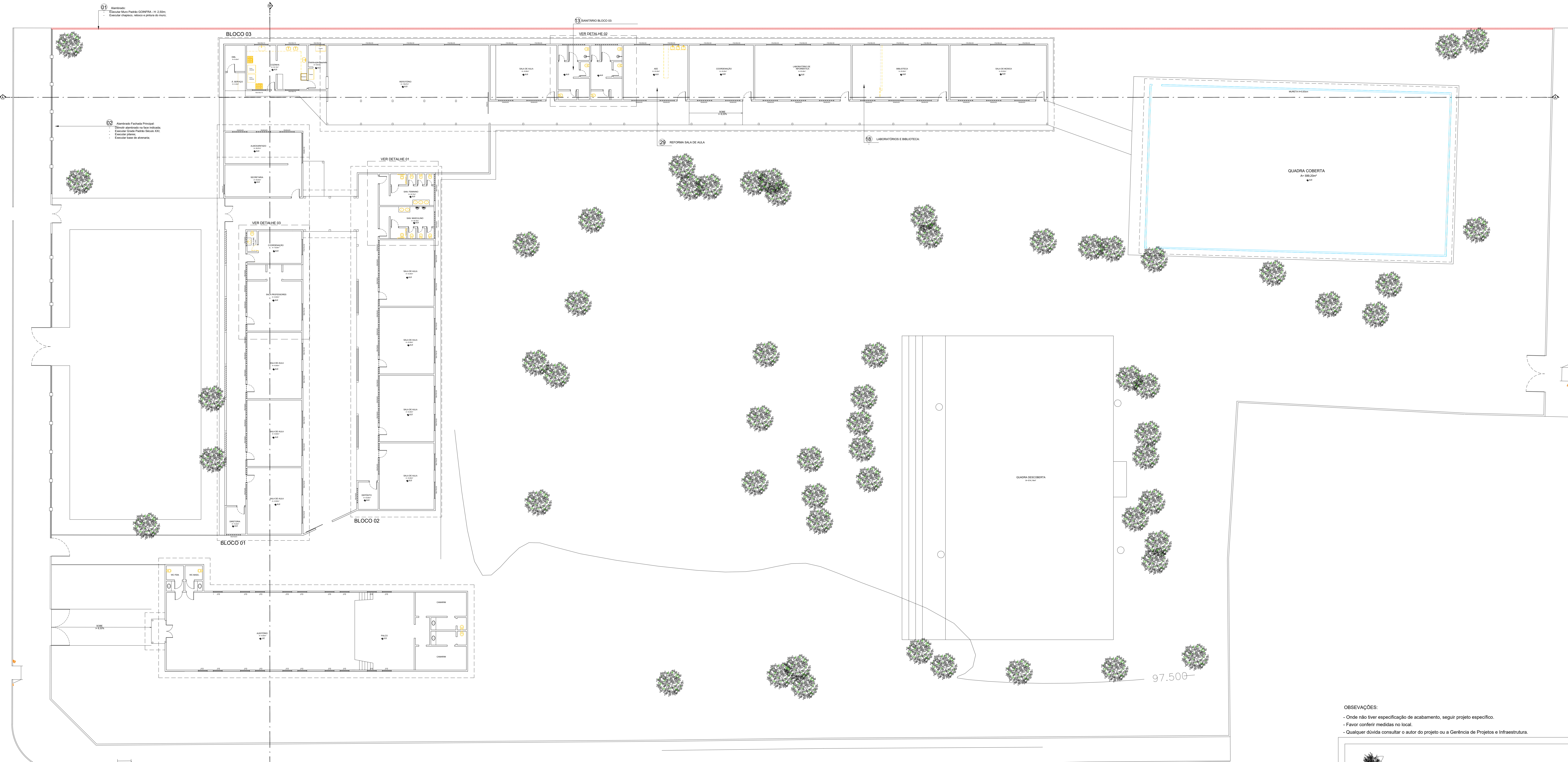
Planta Baixa/Situação atual Escala 1:150